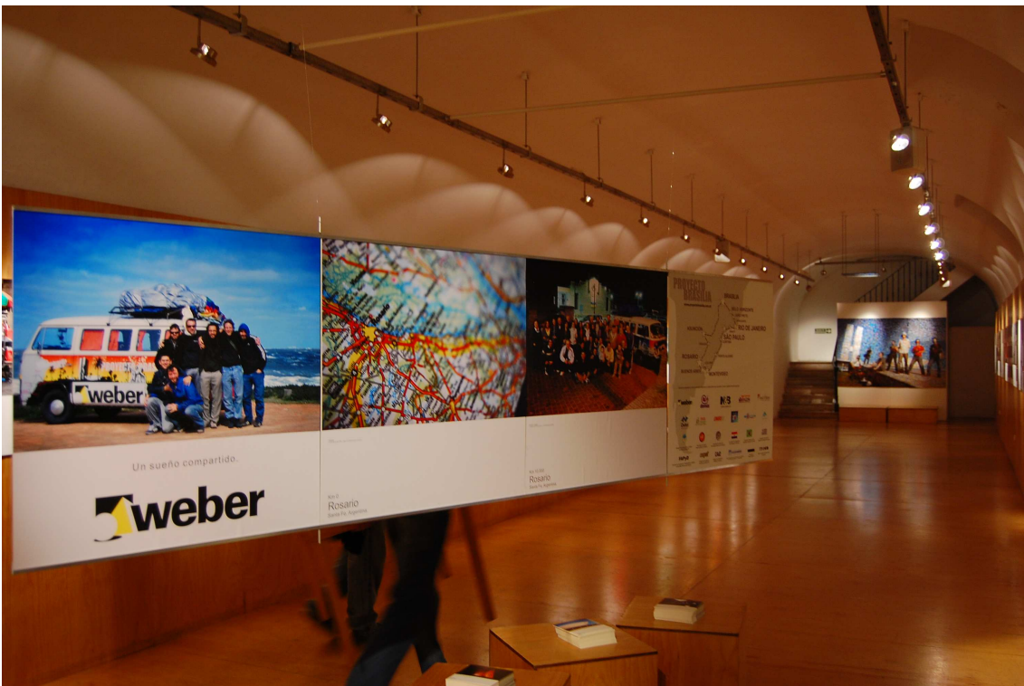
Las fotografías fueron tomadas en la presentación de la muestra en El Túnel del Colegio de Arquitectos de Rosario.