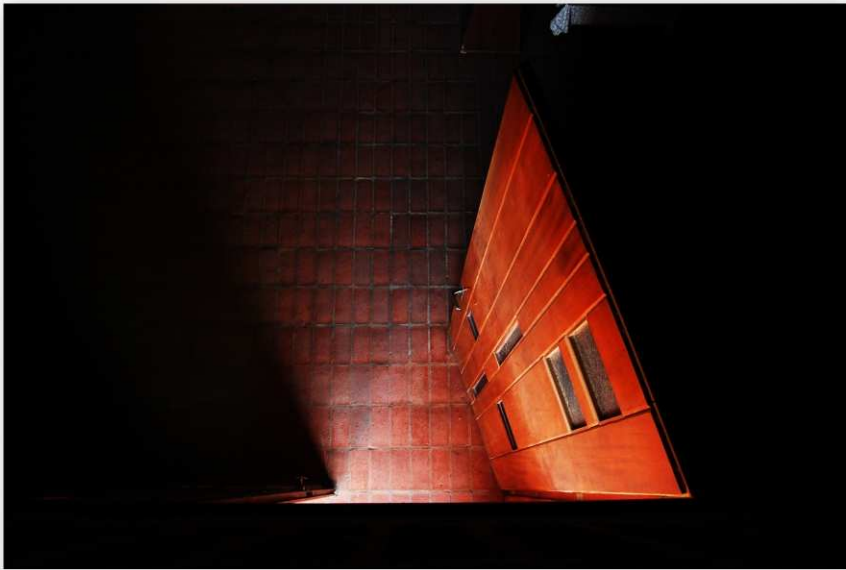
Iglesia Cristo Obrero. Eladio Dieste. 1958.