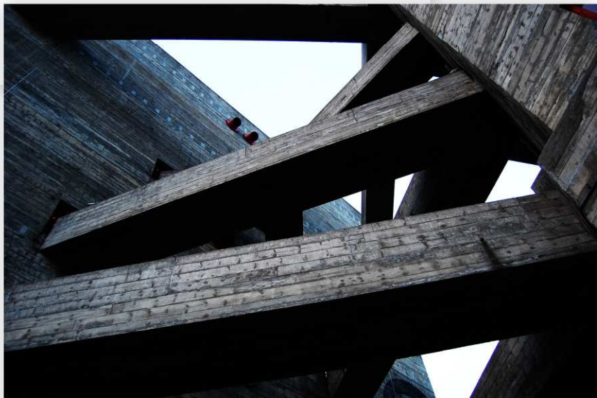
SESC - Pompéia. Lina Bo Bardi. 1977-86.